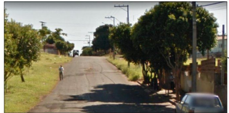
RUA PEDRO GASPARINI PARTE 2 Sem Escala