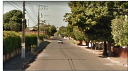
RUA NEMETALA AUDI Sem Escala