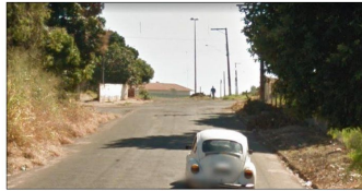
RUA PEDRO GASPARINI PARTE 1 Sem Escala