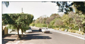
TRAVESSA TV TAQUARI Sem Escala