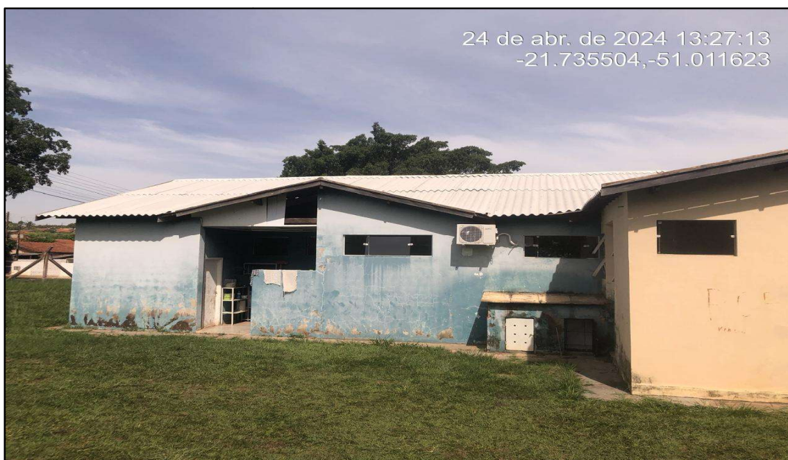
Imagem 2: Situação da obra, do autor, em 25 de Abril de 2024.