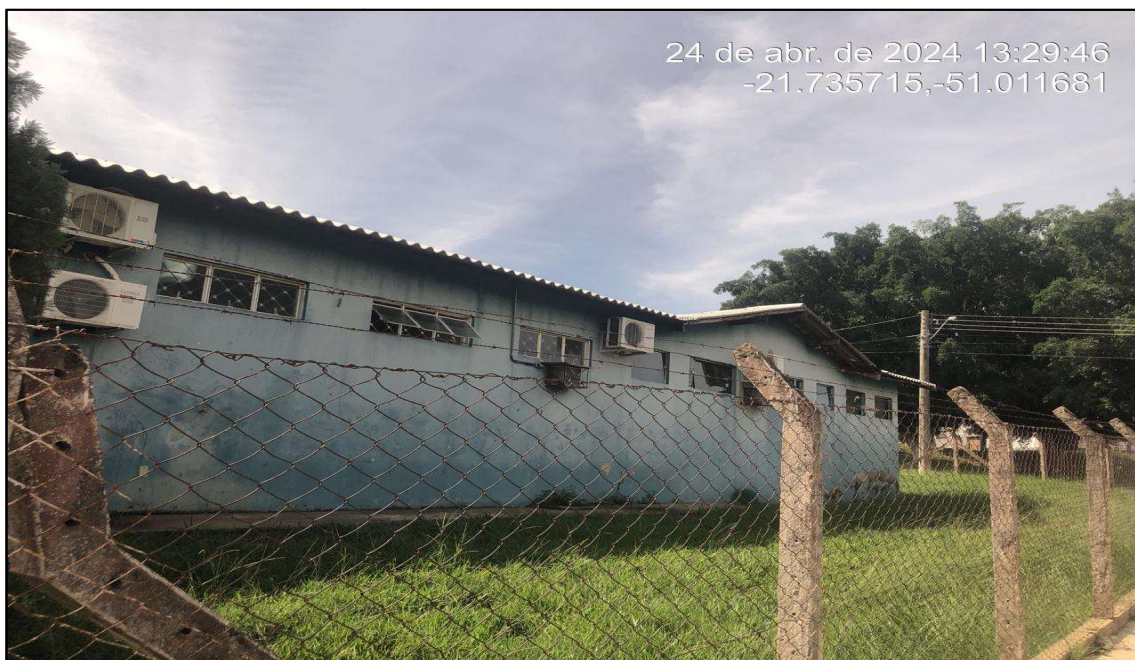
Imagem 5: Situação da obra, do autor, em 25 de Abril de 2024.

Sem mais para o momento, Atenciosamente.