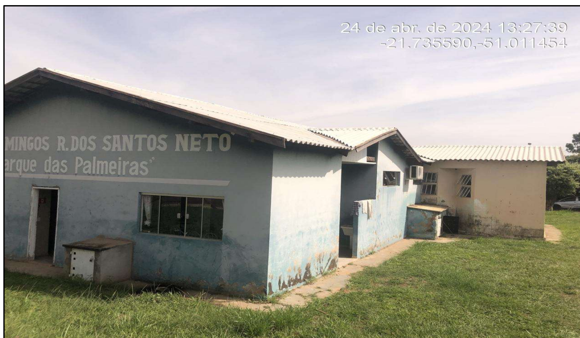
Imagem 3: Situação da obra, do autor, em 25 de Abril de 2024.