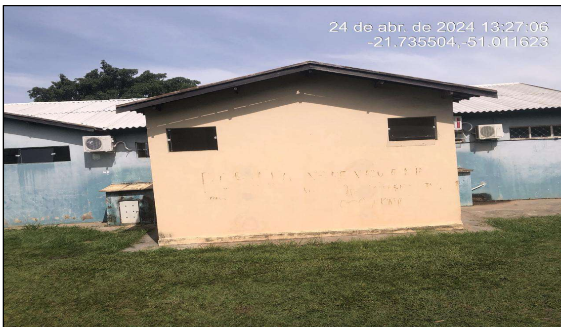
Imagem 1: Situação da obra, do autor, em 25 de Abril de 2024.