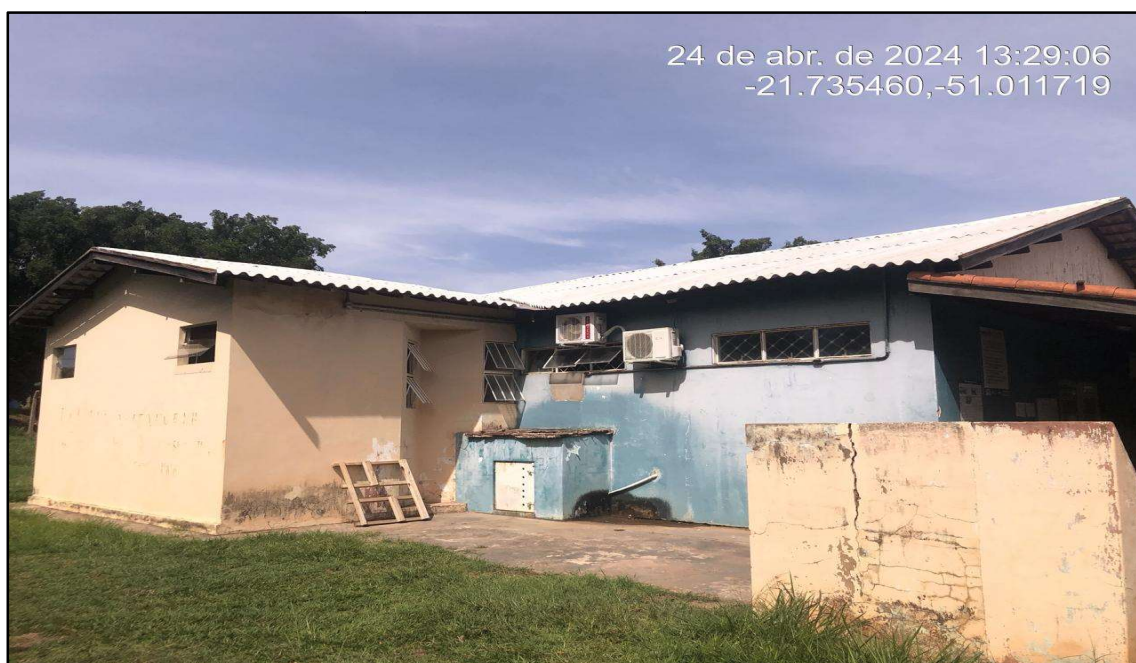
Imagem 4: Situação da obra, do autor, em 25 de Abril de 2024.