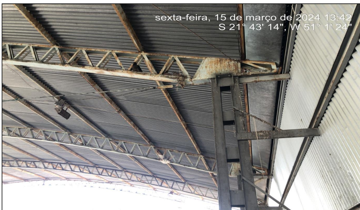
Imagem 3: Situação atual, do autor, em 15 de Março de 2024.