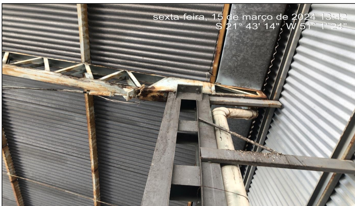
Imagem 2: Situação atual, do autor, em 15 de Março de 2024.