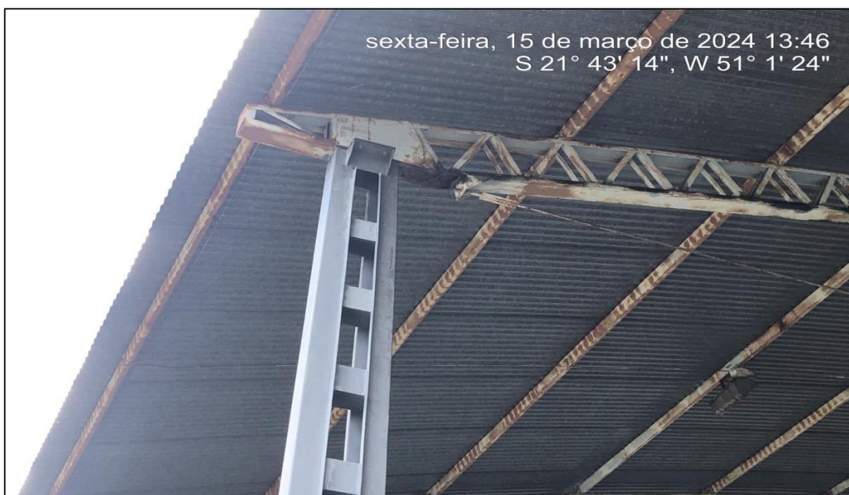
Imagem 4: Situação atual, do autor, em 15 de Março de 2024.