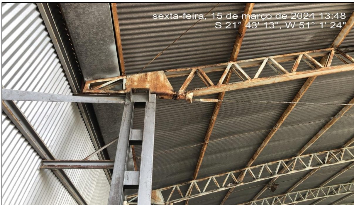
Imagem 5: Situação atual, do autor, em 15 de Março de 2024.

Sem mais para o momento, Atenciosamente.